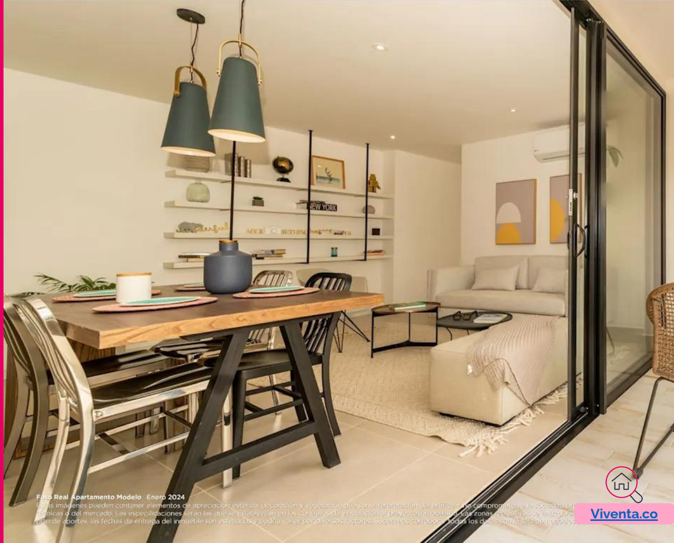
Foto Real Apartamento Modelo Enero 2024

Las imágenes pueden contener elementos de apreciación estética, decoración y verificación que con interpretación de artefactos y no comprometen ni la calidad por técnicas o del mercado. Las especificaciones serán las que se encuentren en los contratos de compraventa al proyecto inmobiliario. Las zonas residenciales y sus zonas de aportes, las fechas de entrega del inmueble son estimadas y podrán variar por diversos factores. Nos reservamos todos los datos con fines de marketing.