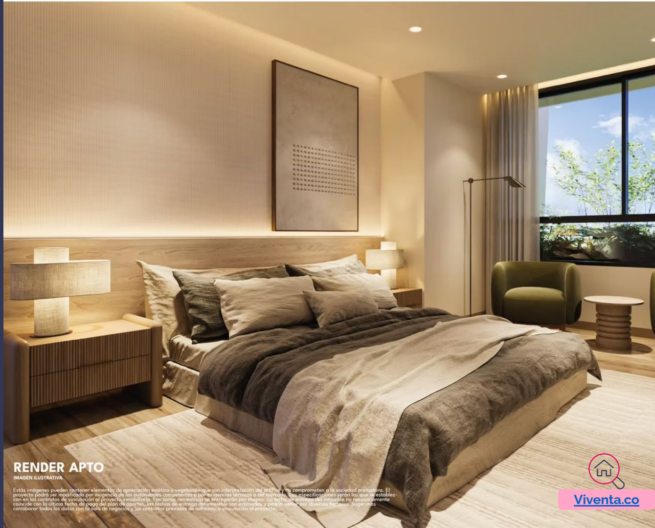
RENDER APTO IMAGEN ILUSTRATIVA

Estas imágenes pueden contener elementos de apreciación estética y vegetación que son interpretación del artista y no comprometen a la sociedad promotor. El proyecto podrá ser modificado por exigencia de las autoridades competentes o por exigencias técnicas o del municipio. Las especificaciones serán las que se establezcan en los contratos de vinculación al proyecto inmobiliario. Las zonas recreativas se entregarán por etapas. La fecha de entrega del inmueble no necesariamente coincide con la última fecha de pago del plan de aportes, las fechas de entrega del inmueble son estimadas y pueden variar por diversos factores. Sugieramos corroborar todos los datos con la sala de negocios y los contratos previos de adhesión o vinculación al proyecto.